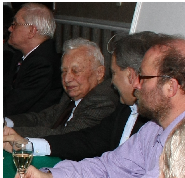
Podczas posiedzenia Komitetu Badań nad Migracjami Ludności i Polonią przy Prezydium Polskiej Akademii Nauk (Jachranka 2011).

Podczas wielu spotkań, które czasami odbywały się nawet dwa razy w miesiącu, mieliśmy możliwość przeprowadzenia nie tylko bardzo głębokiej i polemicznej dyskusji na temat najważniejszych problemów migracyjnych naszego kraju, ale także odnieść się do najważniejszych inicjatyw i projektów realizowanych w tym obszarze zarówno przez administrację, jak też środowiska naukowe i organizacje pozarządowe. Wielogodzinne rozmowy dały mi, z jednej strony, możliwość lepszego poznania poglądów Profesora, z drugiej zaś, przedstawienia w szerokim świetle wielu zagadnień, na których bardzo mi zależało: rekomendacji zawartych w dokumencie „Polityka migracyjna Polski - stan obecny i postulowane działania”, planowanych zmian wynikających z przyjęcia przez Radę Ministrów założeń do nowej ustawy o cudzoziemcach, a także skutków przyjętej przez Rząd tzw. ustawy abolicyjnej. Pozwoliło to wzbogacić dokumenty Kongresu sygnowane przez Rządową Radę Ludnościową, które na obecnym etapie prac generalnie uznają wytyczone kierunki w obszarze imigracji za słuszne i wpisują się w szerszy kontekst postulatów w obszarze polityki ludnościowej.