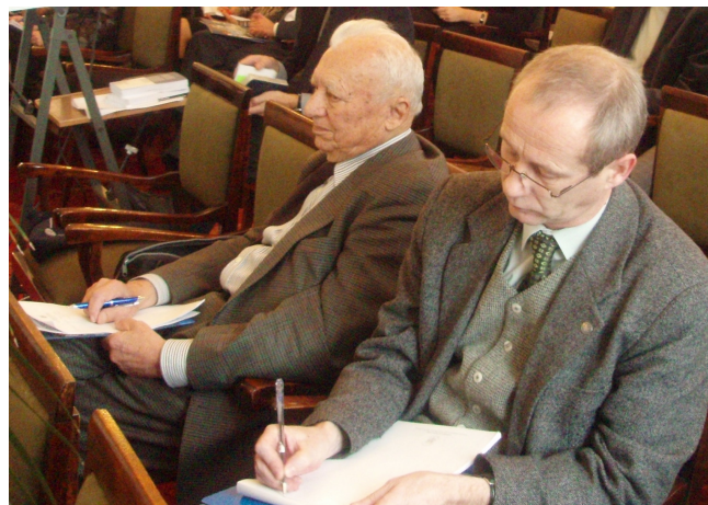
Podczas obchodów 15-lecia Ośrodka Badań nad Migracjami UW.